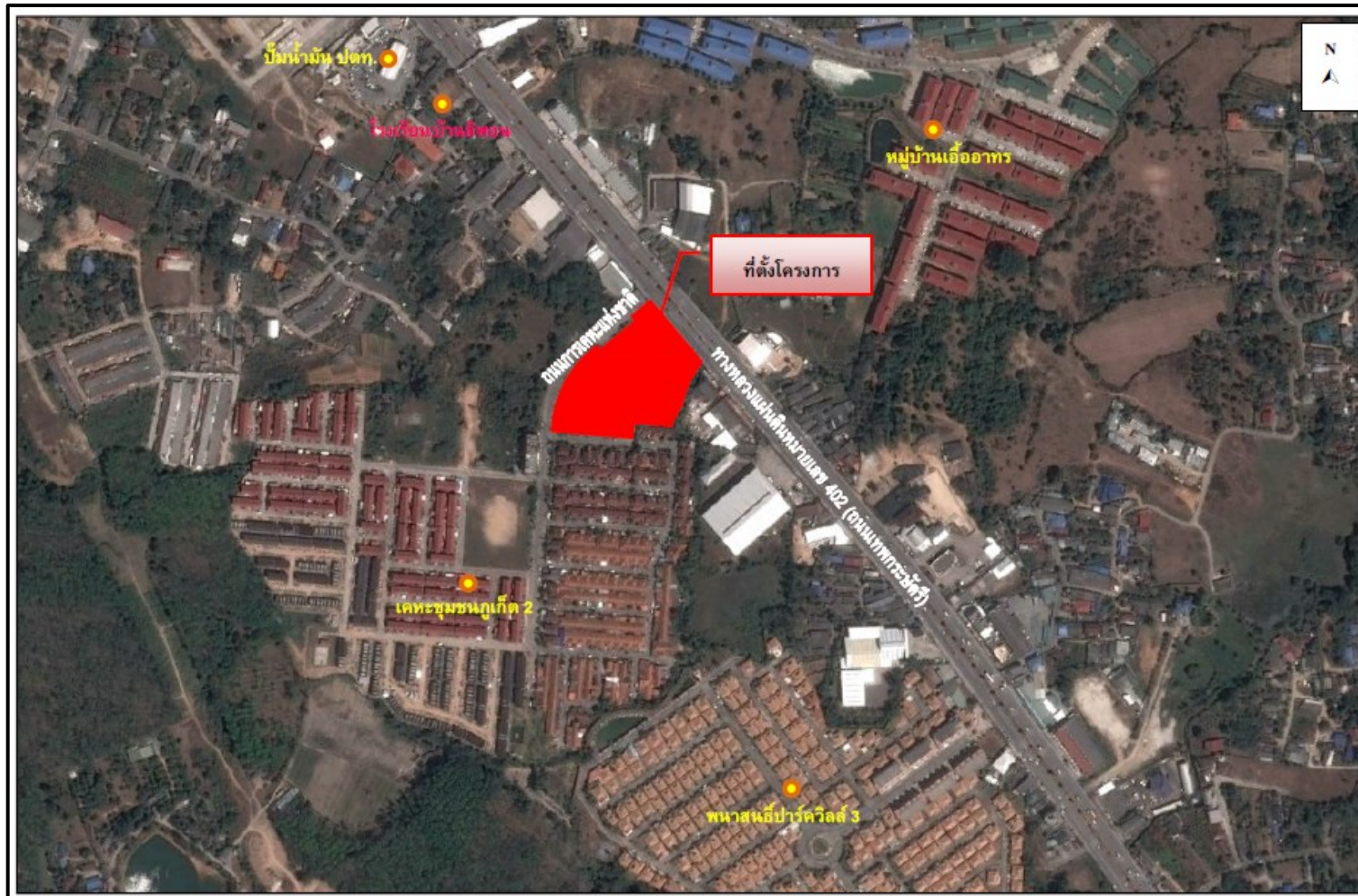
รูปที่ 1.2-1 ที่ตั้งของโครงการ